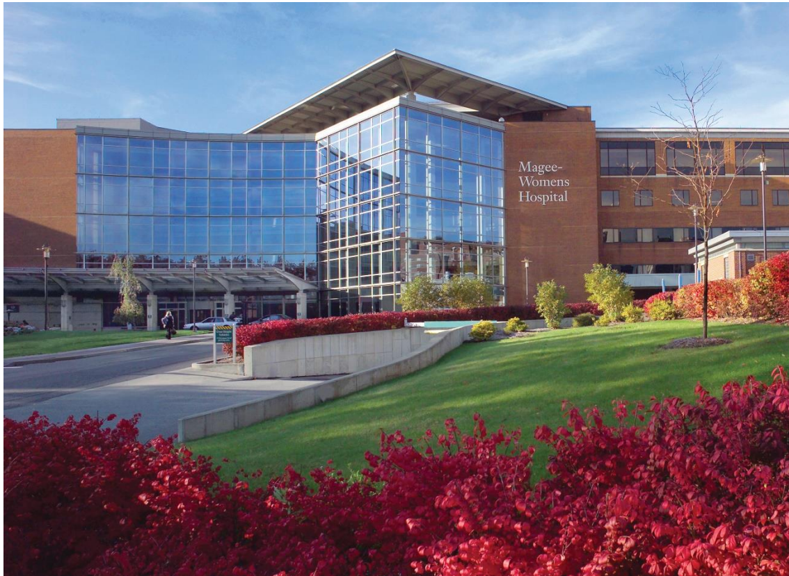
Magee-Women's Hospital- University of Pittsburgh Medical Center Pittsburgh, Pennsylvania-USA